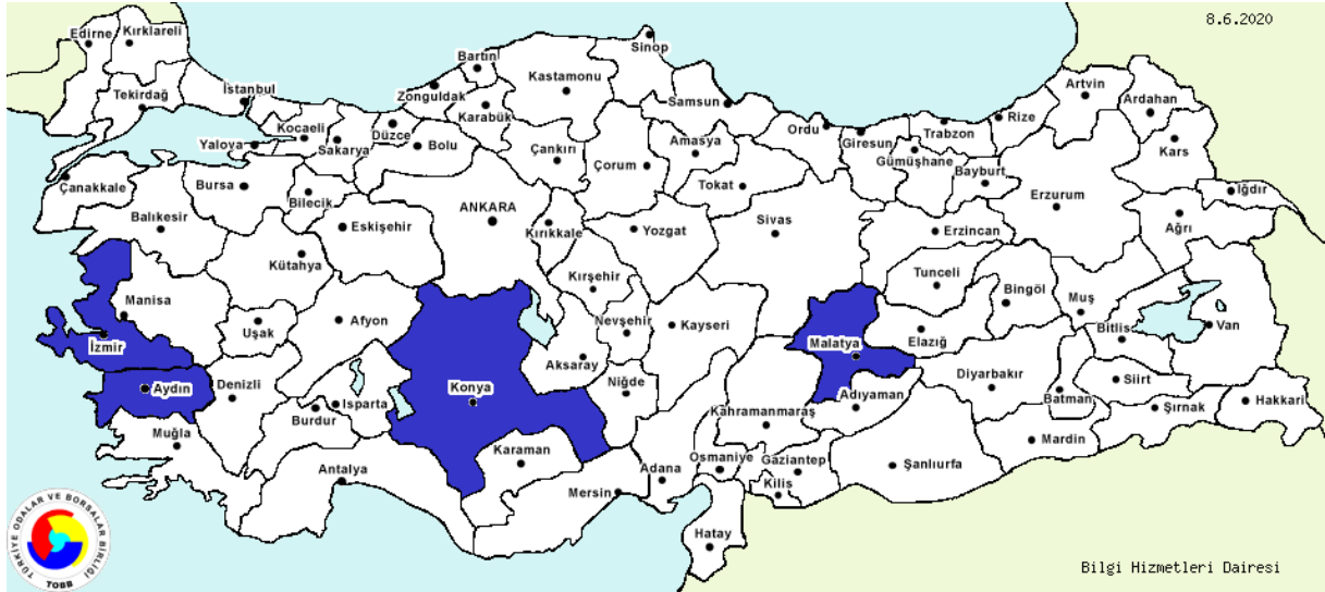
Şekil-2: TOBB 2020 Yılı Veri Tabanına Göre Türkiye’de Kurutulmuş Armut Üretimi Yapan 7 Firma

TOBB 2020 yılı veri tabanına göre Türkiye’de kurutulmuş armut üretimi yapan 7 firma bulunmaktadır. Bu firmaların yıllık toplam üretim kapasiteleri 1,878,131 Kg’dır.