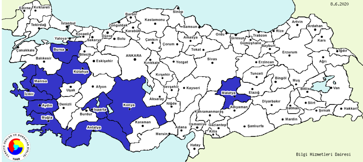
Şekil-1: TOBB 2020 Yılı Veri Tabanına Göre Türkiye’de Kurutulmuş Elma Üretimi Yapan 20 Firma.

Gıda alanında ulusal ve küresel eğilimlerin yanında özelde bakacak olursak Gümüşhane tarımsal sanayi açısından gelişime açık bir ildir. Bu alanda yapılacak yatırımlar farklı kurumlar tarafından desteklenmekte ve teşvik edilmektedir. Tesiste kurutulacak meyve ve sebze türlerinin tedariki ürünlerin hasat ve toplanma zamanına göre değişmektedir. TOBB 2020 yılı veri tabanına göre Türkiye’de kurutulmuş elma üretimi yapan 20 firma vardır. Bu firmaların yıllık toplam kapasiteleri 7,823,230 kg’dır.