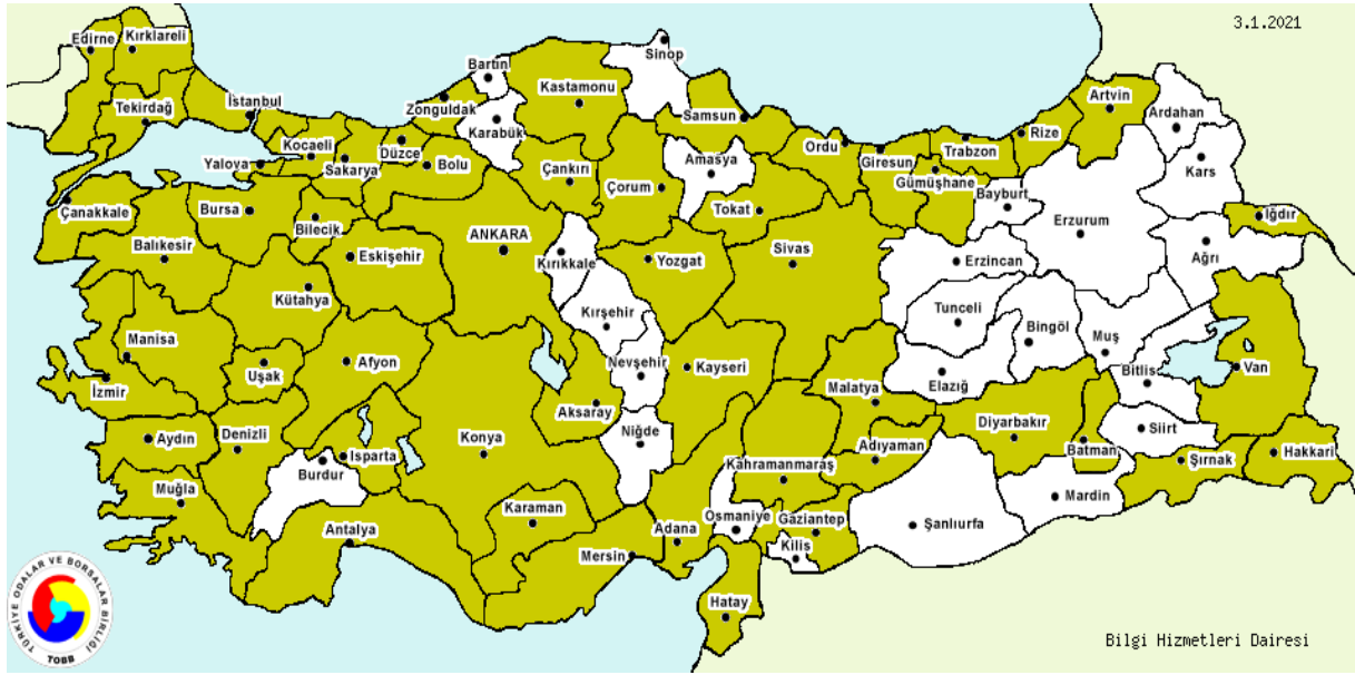
Şekil-3: Türkiye genelinde Kapılar, pencereler ve bunların kasaları ile kapı eşikleri (metalden) sektöründe faaliyet gösteren işletmelerin bölgesel dağılımı, 2020.

*İlgili faaliyet kodunda üretim yapan firmaların bulunduğu iller yeşil renk ile gösterilmiştir.