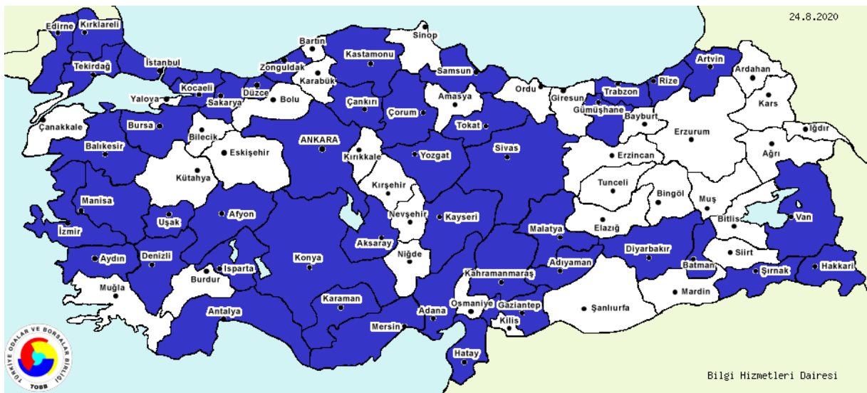
Şekil-1: Kapılar, kapı eşikleri, pencereler ve bunların kasaları (çerçeveleri), demirden veya çelikten imalatı yapan firmaların dağılımı. 2020.

*İlgili faaliyet kodunda üretim yapan firmaların bulunduğu iller mavi renk ile gösterilmiştir.